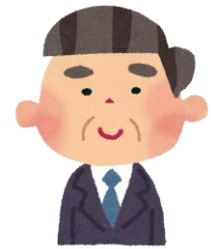
社会福祉法人 統括部長