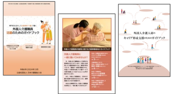
参照：厚生労働省「介護事業者等向けガイドブック」