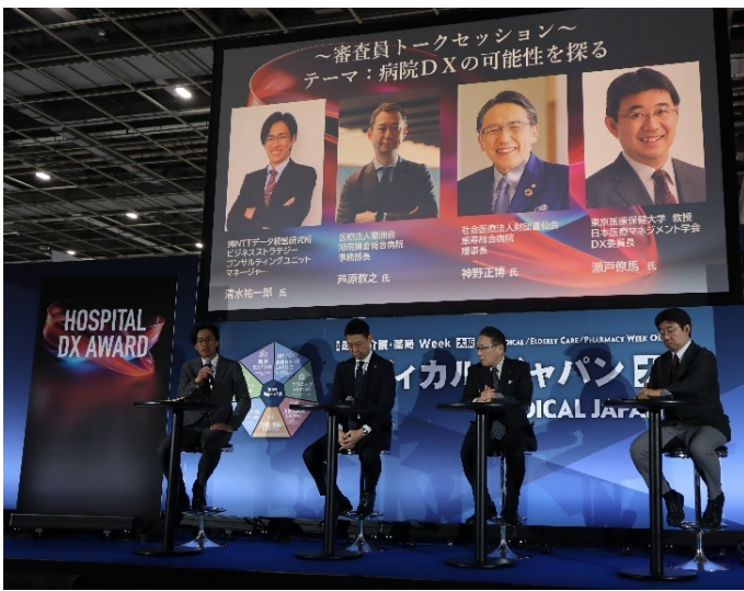
審査員の皆さんによるトークセッション