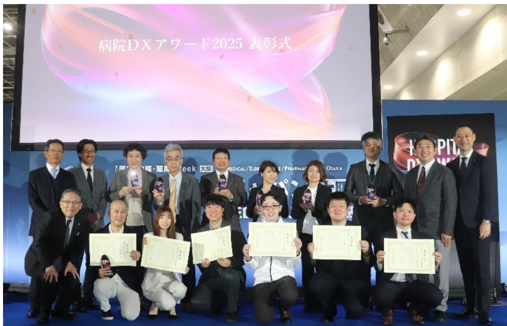
優秀賞受賞6社とそのユーザー様、審査員の皆さん